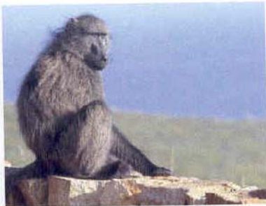
Soms kom je een brutale aap tegen...

voordelen overigens, want met name de sportieve eigenschappen geven zo'n dubbelganger wel fijne stuurkwaliteiten, een goede handling en daardoor eigenlijk extra veiligheid. Dat geldt ook voor de remmen. Een comfortabele toerfiets moet goed remmen. Een sportfiets moet heel goed remmen. Dus zitten er op de FZ1 uitstekende remmen. De achterrem