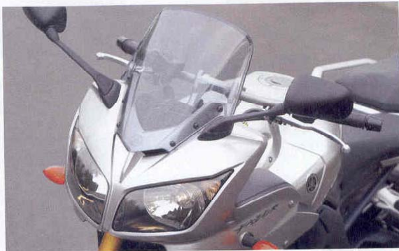
De Fazer heeft een veel grotere neus met dubbele koplamp.