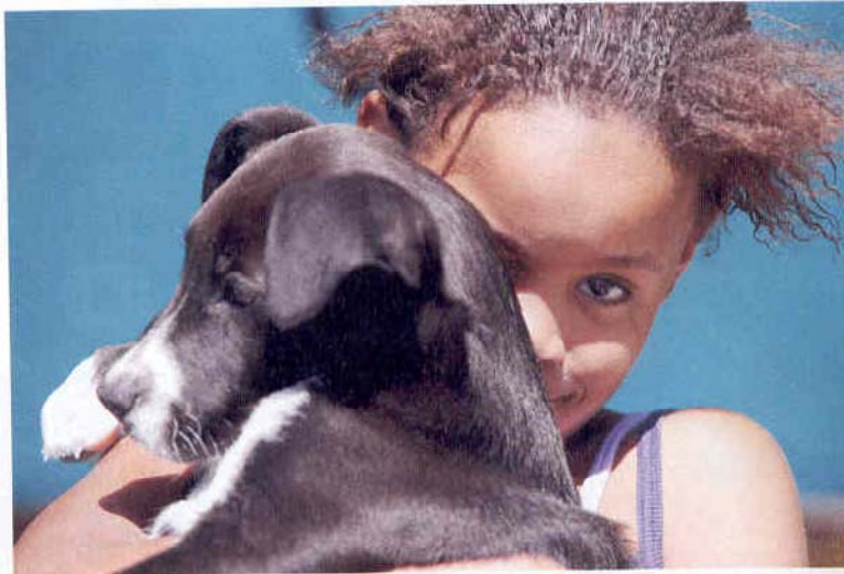
... soms een lief meisje met haar hondje

Toch is er wel degelijk verschil in rijbeleving tussen beide Yamaha's. Bij de naakte beukt de wind keihard tegen je lijf als je de gaskraan opentrekt en het lijkt wel alsof je veel meer voor op de motor zit. Je krijgt zelfs het idee dat hij daardoor beter de bocht ingaat. Kan natuurlijk ➤